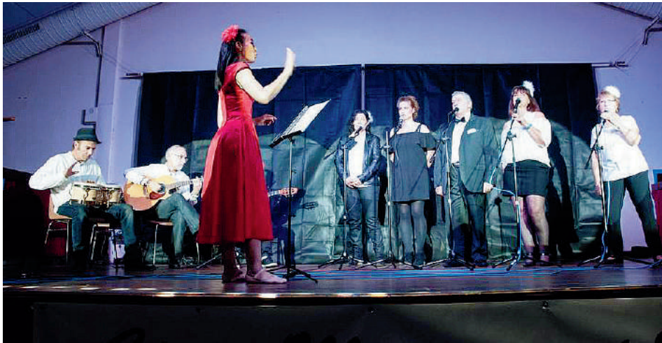
Spectacle 2017 de l'association Cépet Musique et Danse : chanteurs et musiciens

Comme la saison dernière et afin que chacun puisse venir admirer les prouesses d'un membre de la famille, d'un ami, d'un voisin se produisant sur la scène de notre salle des fêtes, l'association propose 2 spectacles.